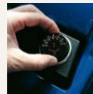
Thermostat (equipped with) Termostato (di serie)